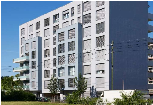
Thônex GE, Chemin du Chablais 8