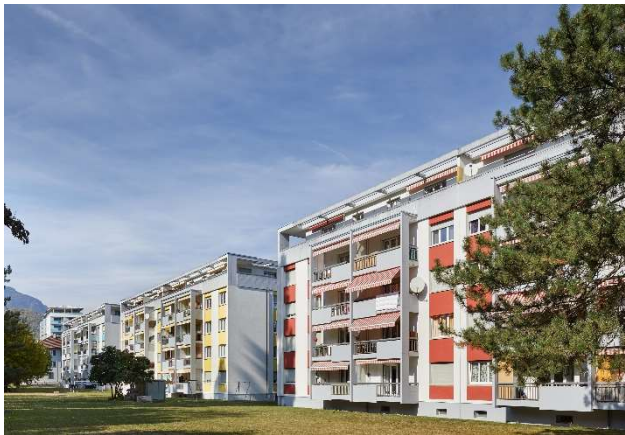
Monthey VS, Rue des Saphirs 2, 4, 10a, 10b, 12a, 12b, 14a, 14b