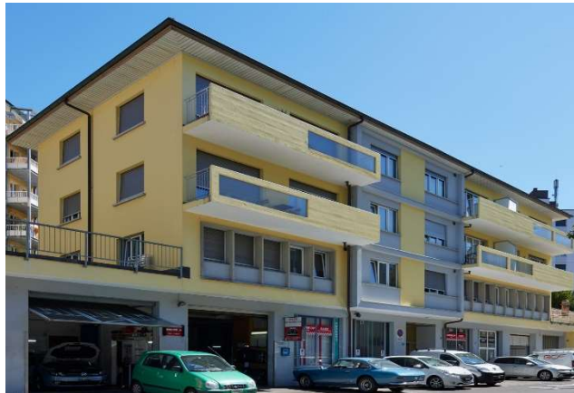
Fribourg FR, Chemin Monséjour 11