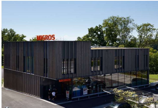
Lutry VD, Route de la Conversion 308