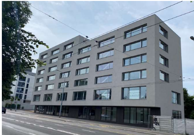
Vernier GE, Route de Vernier 113