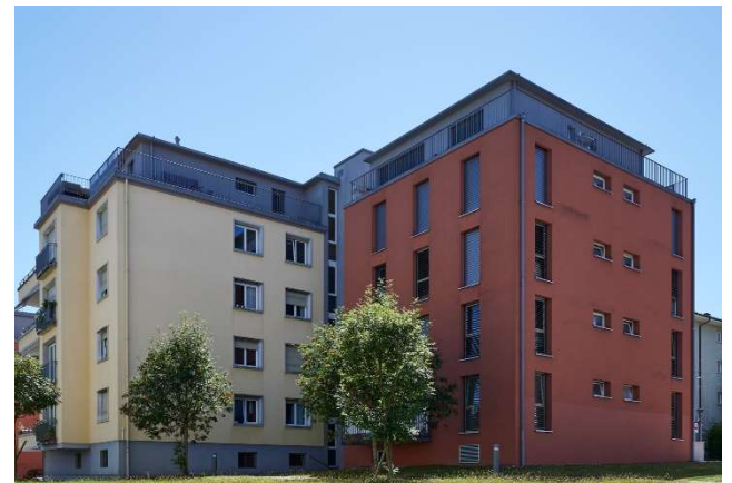
Lausanne VD, Avenue Victor-Ruffly 46, 46a