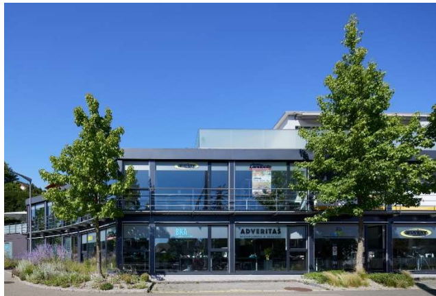
Belp BE, Grubenstrasse 1, 3