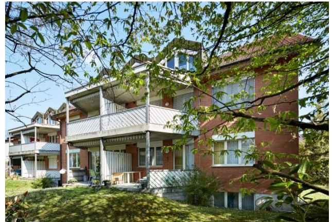
Reinach BL, Mitteldorfstrasse 2, 4