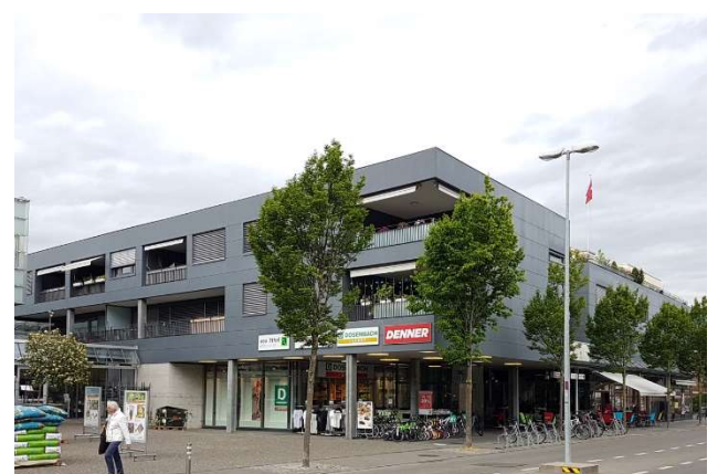
Thun BE, Schulstrasse 26, 28 / Freiestrasse 66