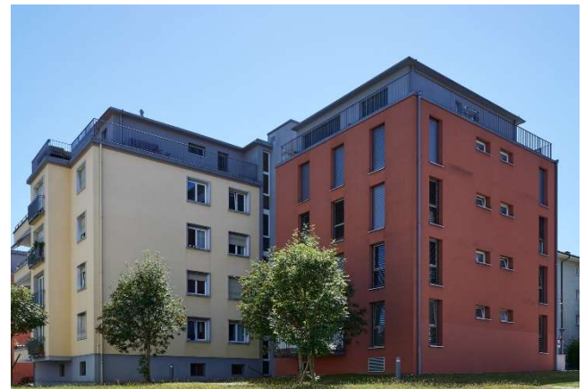
Lausanne VD, Avenue Victor-Ruffy 46, 46a