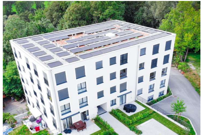
St. Gallen SG, Zürcherstrasse 242b