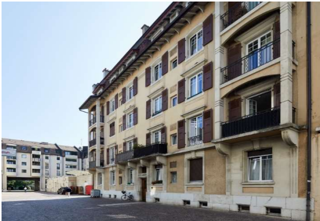
Nyon VD, Rue Juste-Olivier 13