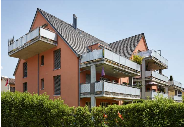
Hombrechtikon ZH, Sonnenbachweg 1