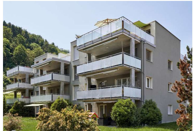
Eglisau ZH, Quentlistrasse 71, 73