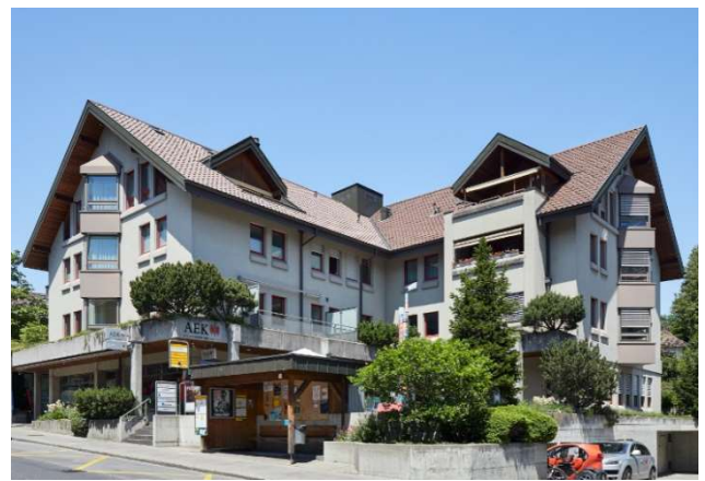
Spiez BE, Oberlandstrasse 9