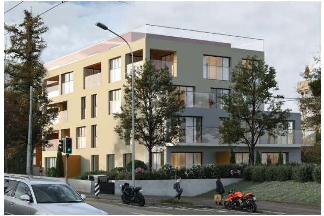
Lausanne VD, Avenue du Grey 60-62

Utilisation habitation Achèvement mai 2023 Valeur vénale (après achèvement) env. CHF 23,904 mio. Rendement brut (après achèvement) env. 3,0 % Terrain achat au 24 septembre 2021