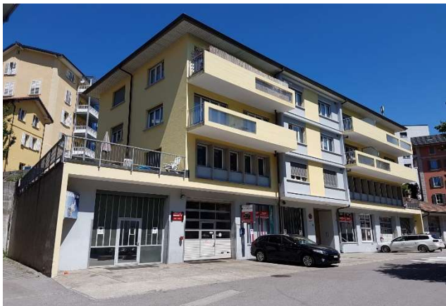
Fribourg FR, Chemin Monséjour 11