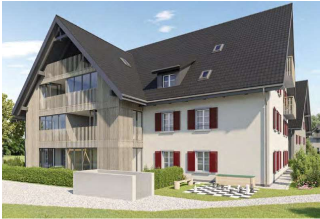
Obfelden ZH, Wolserstrasse 30 a/b

Utilisation habitation Achèvement janvier 2023 Valeur vénale (après achèvement) env. CHF 16,440 mio. Rendement brut (après achèvement) env. 3,4 % Terrain achat au 2 juillet 2021