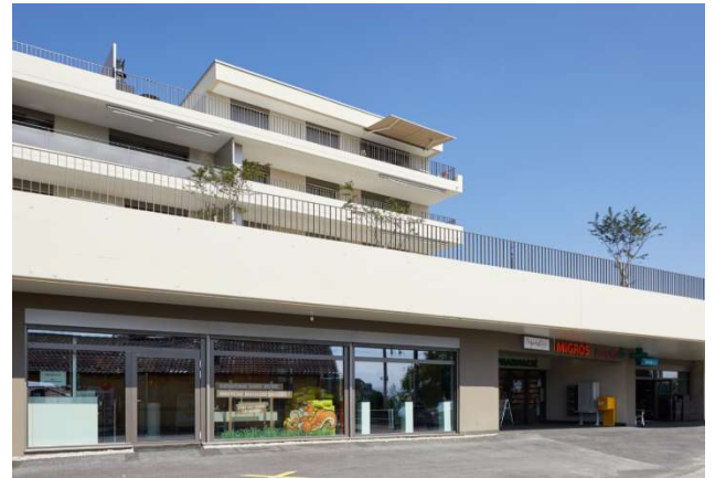
Neyruz FR, Chemin de la Gare 8