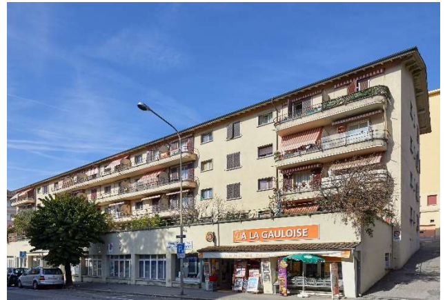
Corsier-sur-Vevey VD, Chemin-Vert 7, 9, 11