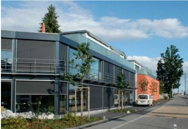
Belp BE, Grubenstrasse 1,3