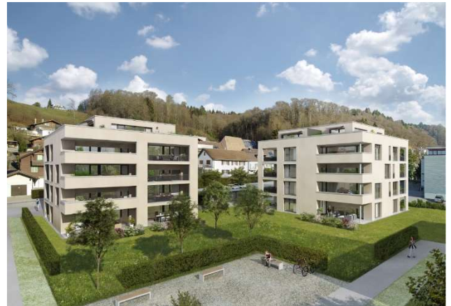
Zofingen AG, Riedtalstrasse 20b, 20d