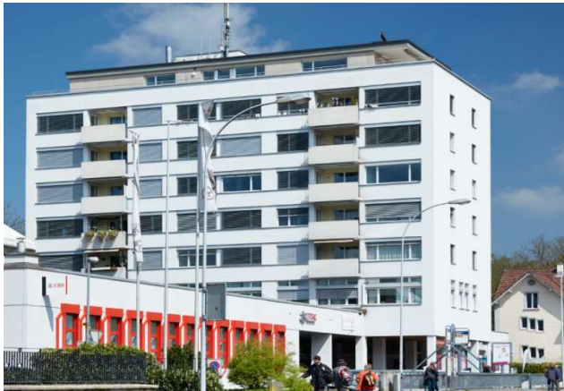
Bremgarten AG, Zürcherstrasse 15