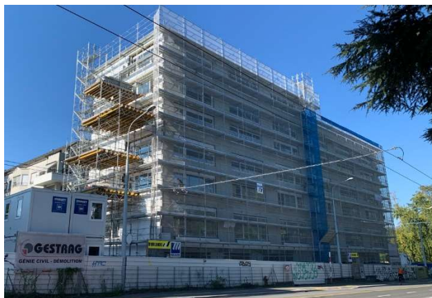
Vernier GE, Route de Vernier 113

Utilisation mixte Achèvement février 2023 Valeur vénale (après achèvement) env. CHF 21,000 mio. Rendement brut (après achèvement) env. 3,7 % Achat au à l'achèvement