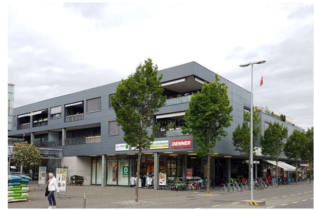
Thun BE, Schulstrasse 26, 28 / Freiestrasse 66