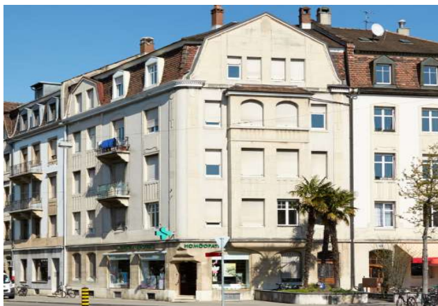
Bâle BS, Wettsteinplatz 3