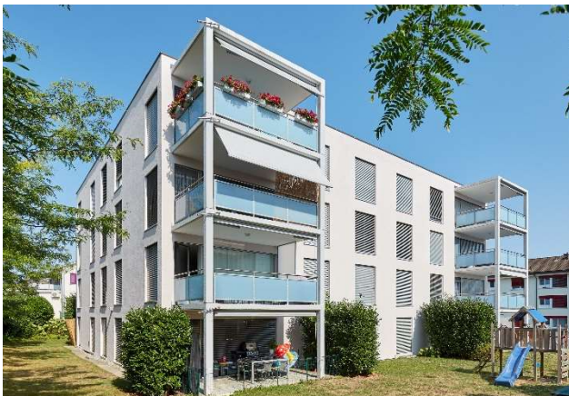
Kreuzlingen TG, Romanshorerstrasse 41