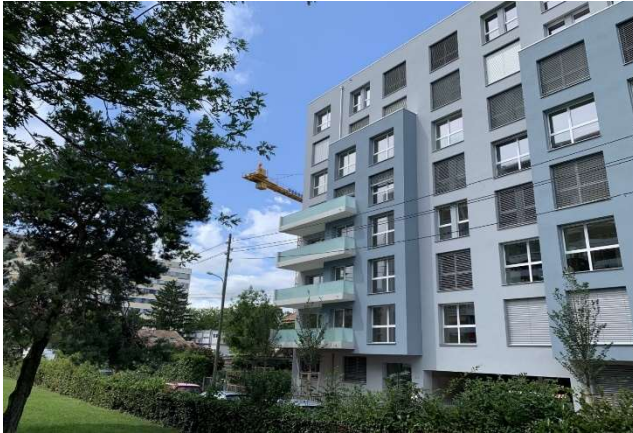
Thônex GE, Chemin du Chablais 8