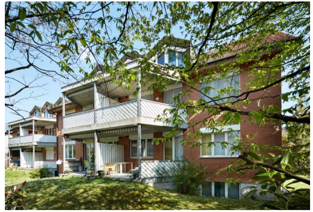
Reinach BL, Mitteldorfstrasse 2, 4