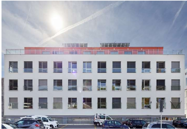
Clarens VD, Avenue Rousseau 24 / Avenue de Châtelard 1