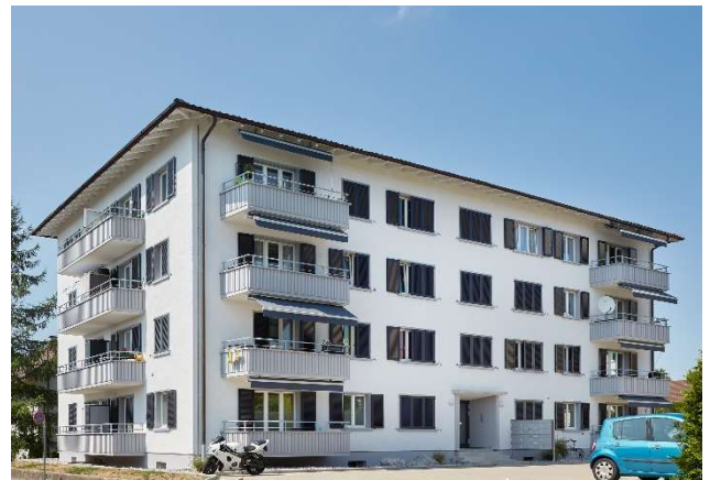
Tann-Dürnten ZH, Bogenackerstrasse 24