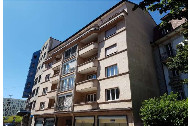
Fribourg FR, Rue Frédéric-Chaillet 6