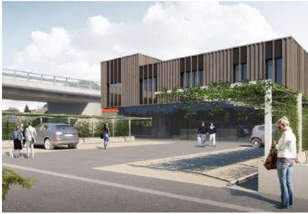
Lutry VD, Route de la Conversion 308