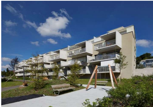
Hedingen ZH, Affolternstrasse 8, 10