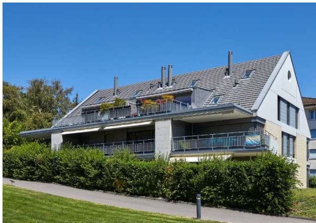
Rolle VD, Chemin des Plantaz 10