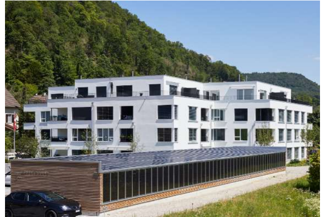
Liestal BL, Gasstrasse 34