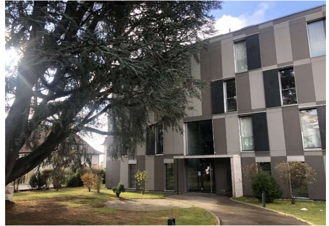
Prilly VD, Avenue du Château 5