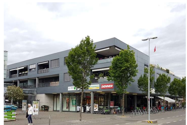
Thun BE, Schulstrasse 26, 28 / Freiestrasse 66