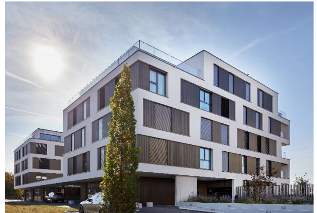
Prilly VD, Route de Cossonay 55, 57