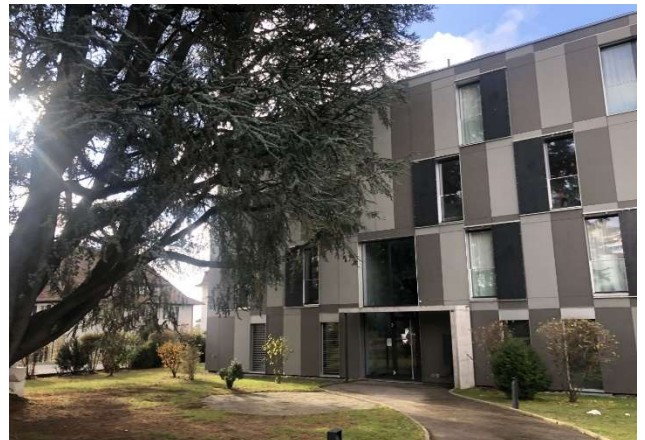
Prilly VD, Avenue du Château 5