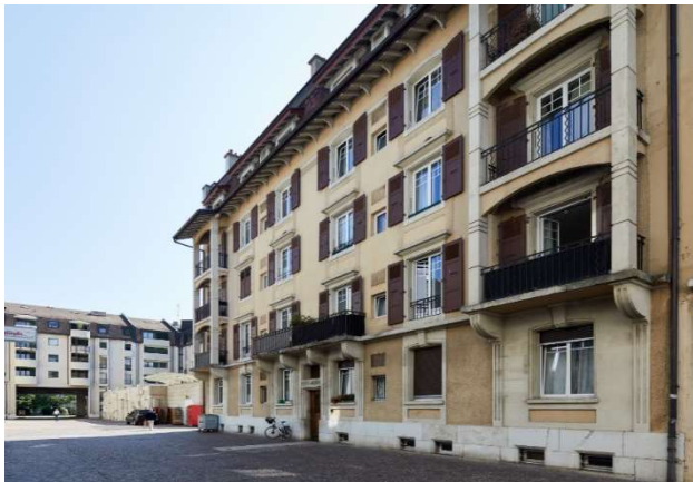
Nyon VD, Rue Juste-Olivier 13