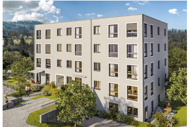
St. Gallen SG, Zürcherstrasse 242b