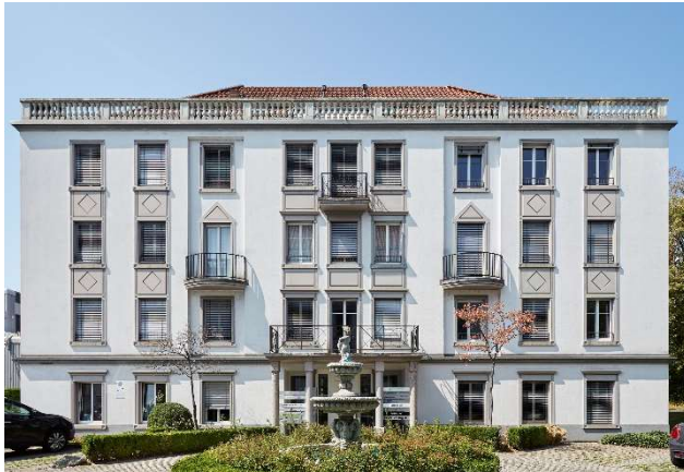
Dübendorf ZH, Überlandstrasse 105, 107, 109, 111