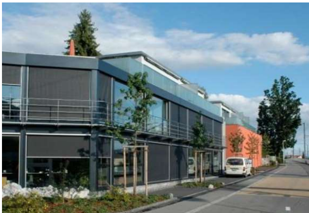
Belp BE, Grubenstrasse 1,3