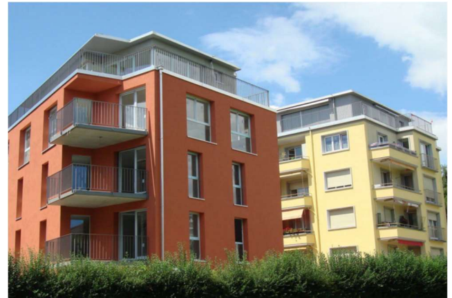
Lausanne VD, Avenue Victor-Ruffly 46, 46a