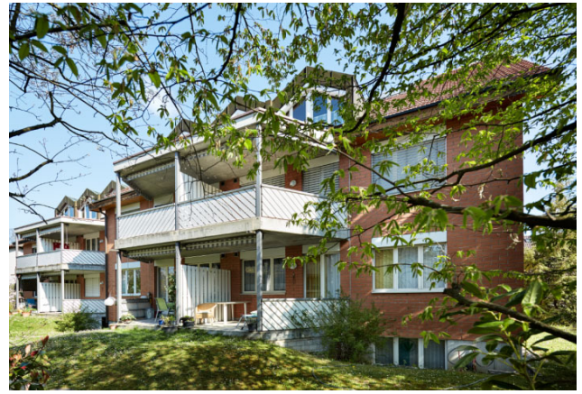
Reinach BL, Mitteldorfstrasse 2, 4