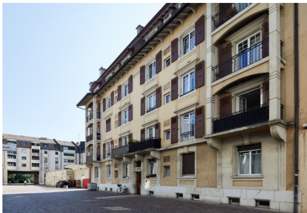
Nyon VD, Rue Juste-Olivier 13