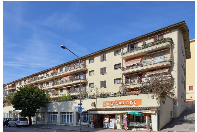
Corsier-sur-Vevey VD, Chemin-Vert 7, 9, 11