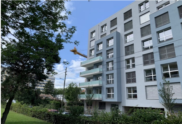
Thônex GE, Chemin du Chablais 8