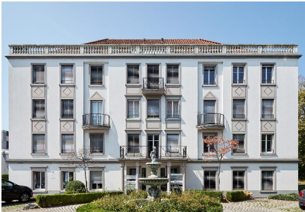
Dübendorf ZH, Überlandstrasse 105-111