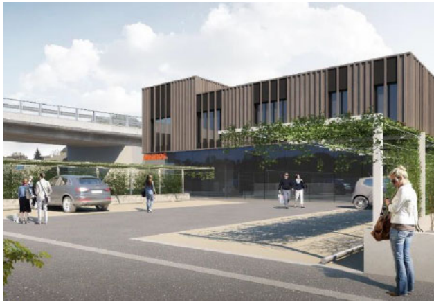
Lutry VD, Route de la Conversion 308