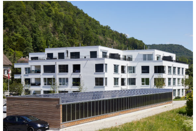
Liestal BL, Gasstrasse 34