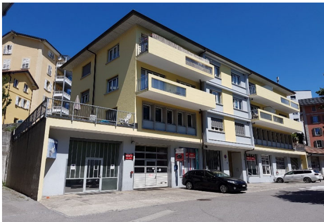
Fribourg FR, Chemin Monséjour 11