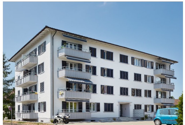
Tann-Dürnten ZH, Bogenackerstrasse 24