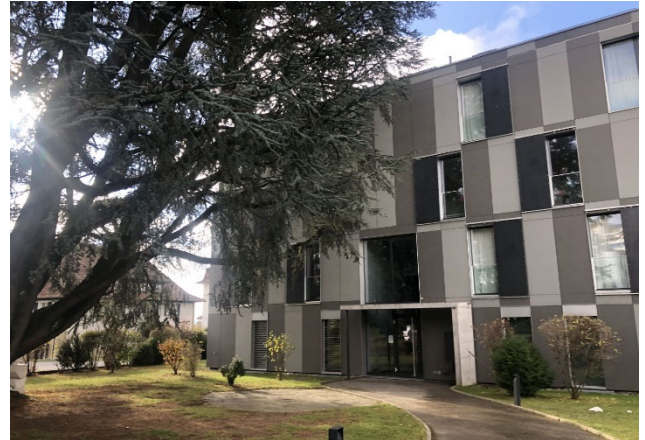
Prilly VD, Avenue du Château 5