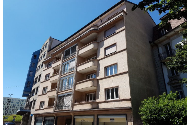
Fribourg FR, Rue Frédéric-Chaillet 6