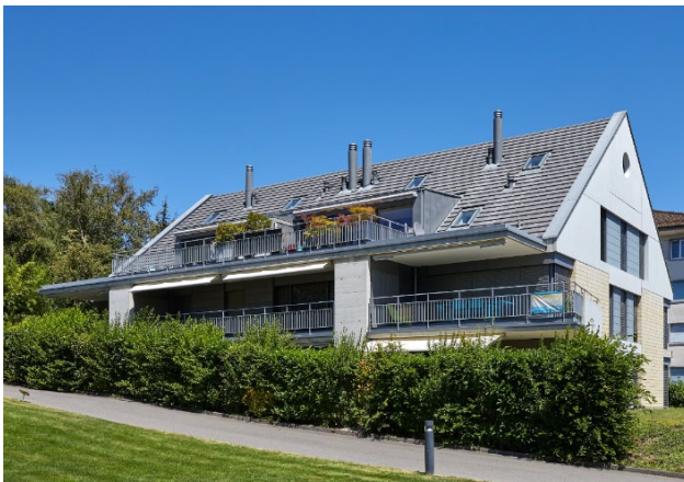
Rolle VD, Chemin des Plantaz 10