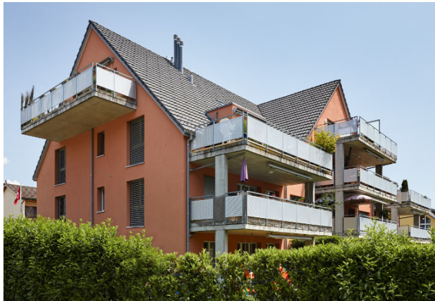
Hombrechtikon ZH, Sonnenbachweg 1