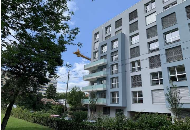
Thônex GE, Chemin du Chablais 8