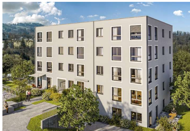
Saint-Gall SG, Zürcherstrasse 242b