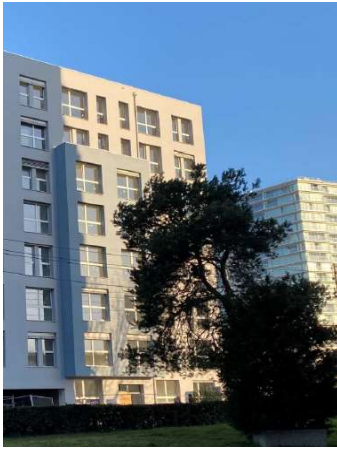
Thônex GE, Chemin du Chablais 8