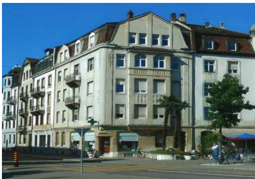
Basel BS, Wettsteinplatz 3