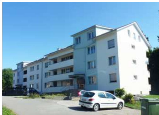
Othmarsingen AG, Fallenacker 2, 2a