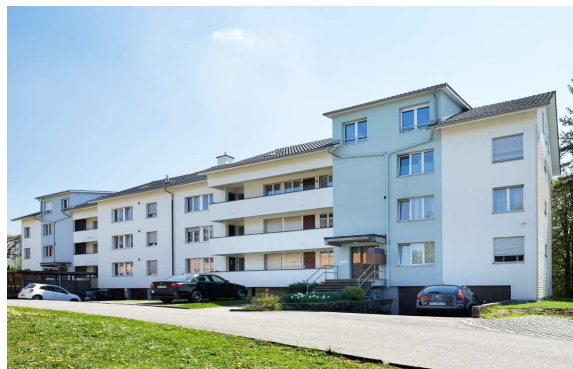
Othmarsingen AG, Fallenacker 2, 2a