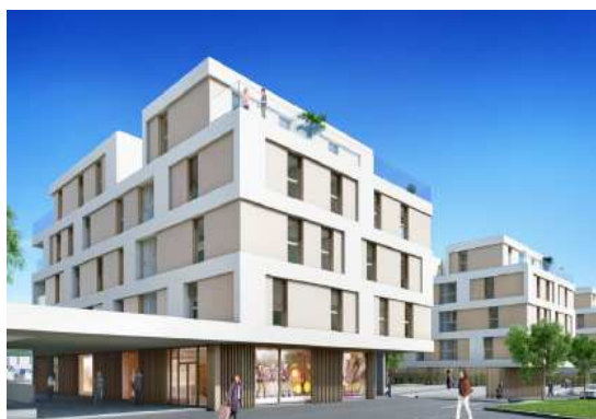
Prilly VD, Route de Cossonay