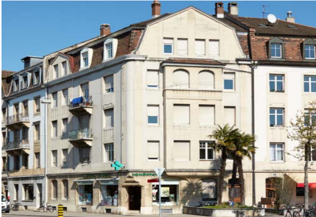
Basel BS, Wettsteinplatz 3

Nutzung Gemischt Baujahr 1910 Verkehrswert CHF 4.004 Mio. Bruttorendite (Soll) 4.8 % Vermietungsquote 64.4 % Kauf per 1. Januar 2016