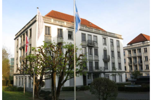
Dübendorf ZH, Überlandstrasse 105-111

Nutzung Kommerziell Baujahr 1989-1993 Verkehrswert CHF 22.567 Mio. Bruttorendite (Soll) 5.4 % Vermietungsquote 94.3 % Kauf per 28. Juni 2017