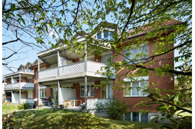
Reinach BL, Mitteldorfstrasse 2, 4

Nutzung Gemischt Baujahr 1988 Verkehrswert CHF 6.899 Mio. Bruttorendite (Soll) 4.6 % Vermietungsquote 89.7 % Kauf per 1. Dezember 2015