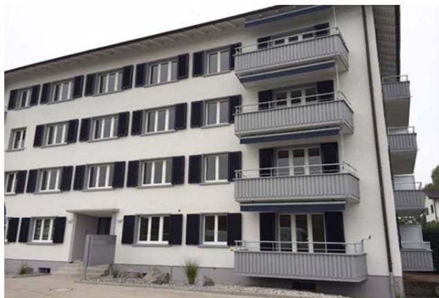
Tann-Dürnten ZH, Bogenackerstrasse 24

Nutzung Wohnen Baujahr 1955 Verkehrswert CHF 7.360 Mio. Bruttorendite (Soll) 3.7 % Vermietungsquote 100.0 % Kauf per ca. März 2018