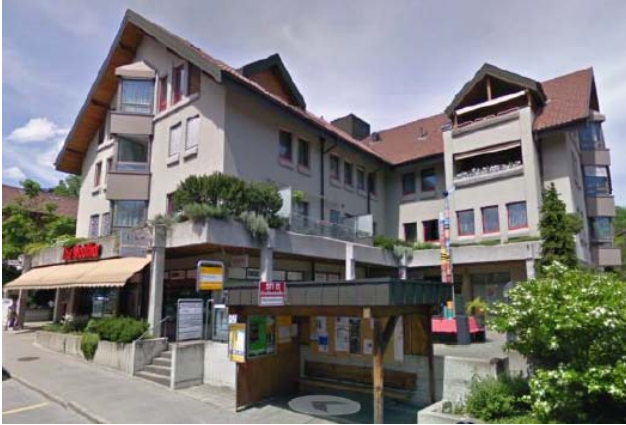
Spiez BE, Oberlandstrasse 9

Nutzung Kommerziell Baujahr 1989 Verkehrswert CHF 6.140 Mio. Bruttorendite (Soll) 5.4 % Vermietungsquote 87.9 % Kauf per 1. Januar 2017