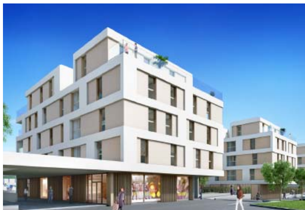
Prilly VD, Route de Cossonay

Nutzung Gemischt Baujahr 2018 Verkehrswert (nach Fertigstellung) CHF 28.618 Mio. Bruttorendite (Soll) 4.4 % Vermietungsquote - Fertigstellung 1. Juli 2018