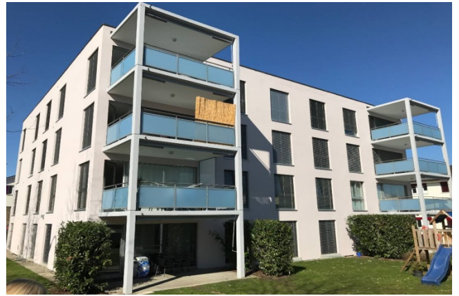
Kreuzlingen TG, Rorschacherstrasse 41

Nutzung Wohnen Baujahr 2005 Verkehrswert CHF 8.310 Mio. Bruttorendite (Soll) 3.9 % Vermietungsquote 99.4 % Kauf per 31. Dezember 2017