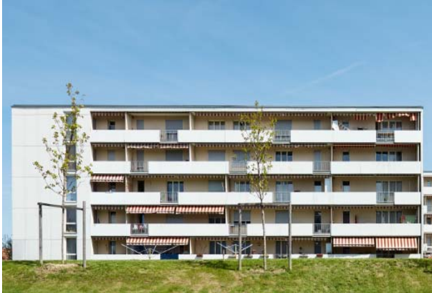
Estavayer-le-lac FR, Cité du Bel-Air 4, 6, 8

Nutzung Wohnen Baujahr 1963 Verkehrswert CHF 14.520 Mio. Bruttorendite (Soll) 4.9 % Vermietungsquote 97.1 % Kauf per 1. November 2015