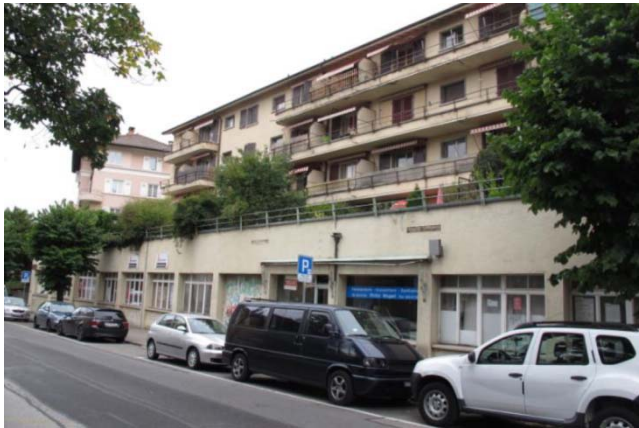
Corsier-sur-Vevey VD, Chemin-Vert 7, 9, 11

Nutzung Wohnen Baujahr 1955 Verkehrswert CHF 12.434 Mio. Bruttorendite (Soll) 4.4 % Vermietungsquote 100.0 % Kauf per 7. Dezember 2017