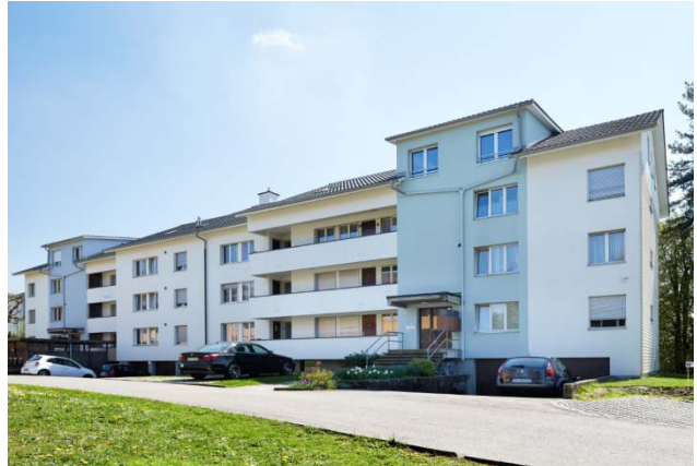
Othmarsingen AG, Fallenacker 2, 2a

Nutzung Wohnen Baujahr 1963 Verkehrswert CHF 6.624 Mio. Bruttorendite (Soll) 5.1 % Vermietungsquote 78.4 % Kauf per 1. Februar 2016