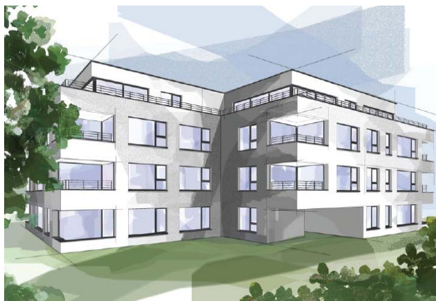
Liestal BL, Gasstrasse 34

Nutzung Wohnen Baujahr 2018 Verkehrswert (nach Fertigstellung) CHF 16.860 Mio. Bruttorendite (Soll) 4.3 % Vermietungsquote - Fertigstellung 30. Oktober 2018