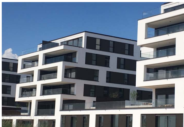
Prilly VD, Route de Cossonay 55 - 57

Nutzung Gemischt Baujahr 2018 Verkehrswert CHF 30.190 Mio. Bruttorendite (Soll) 4.2 % Vermietungsquote (ab 1. Juli 2018) 88.2 % Kauf per 20. Juni 2018