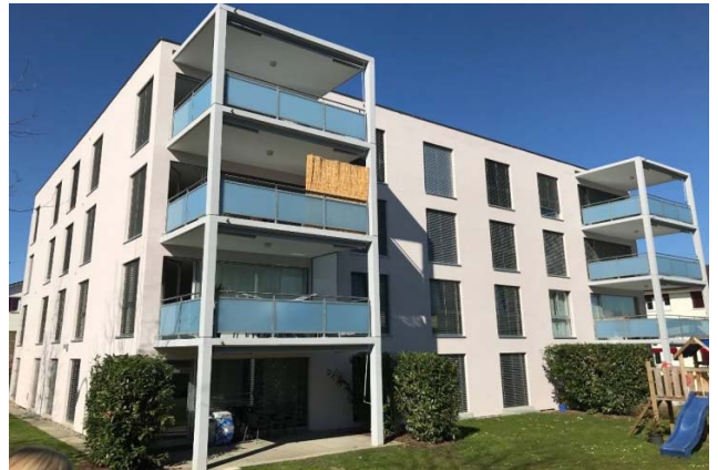
Kreuzlingen TG, Romanshornerstrasse 41

Nutzung Wohnen Baujahr 2005 Verkehrswert CHF 8.310 Mio. Bruttorendite (Soll) 3.9 % Vermietungsquote 90.6 % Kauf per 31. Dezember 2017