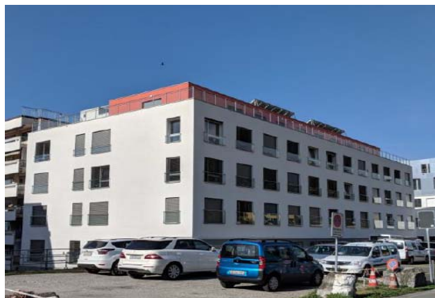
Clarens VD, Avenue Rousseau 24 / Avenue de Châtelard 1

Nutzung Wohnen Baujahr 1974 Verkehrswert CHF 27.719 Mio. Bruttorendite (Soll) 4.2 % Vermietungsquote 97.6 % Kauf per 1. Juni 2018