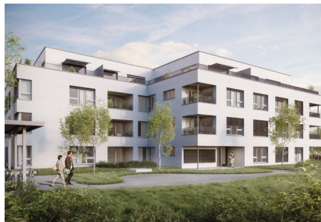
Liestal BL, Gasstrasse 34

Nutzung Wohnen Baujahr 2018 Verkehrswert nach Fertigstellung ca. CHF 17.090 Mio. Bruttorendite (Soll) nach Fertigstellung ca. 4.1 % Vermietungsquote - Fertigstellung 27. Oktober 2018