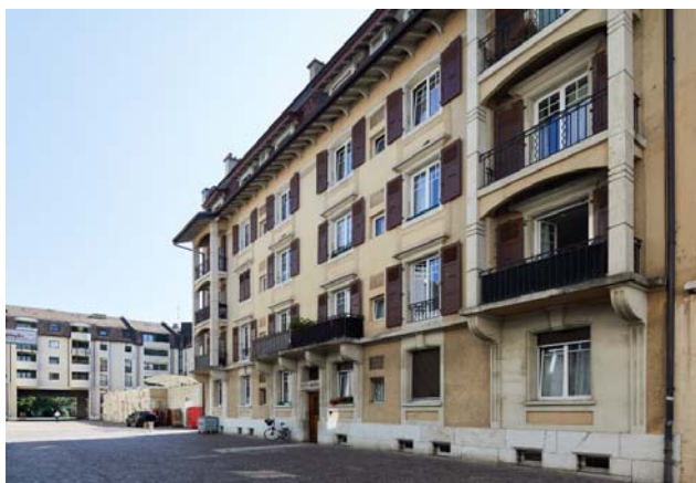
Nyon VD, Rue Juste-Olivier 13