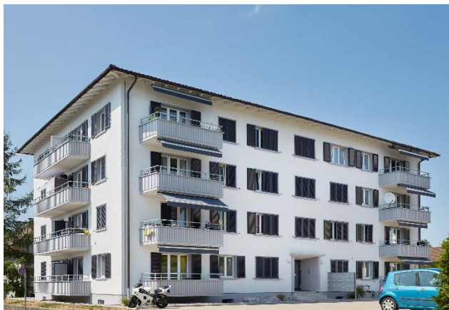
Tann-Dürnten ZH, Bogenackerstrasse 24

Nutzung Wohnen Baujahr 1955 Verkehrswert CHF 7.390 Mio. Bruttorendite (Soll) 3.7 % Vermietungsquote 99.3 % Kauf per 1. Mai 2018