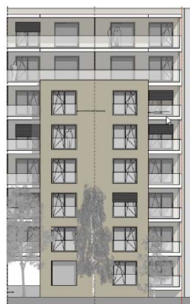
Thônex GE, Chemin du Chablais 8