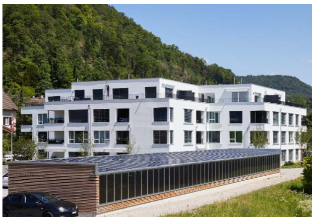
Liestal BL, Gasstrasse 34