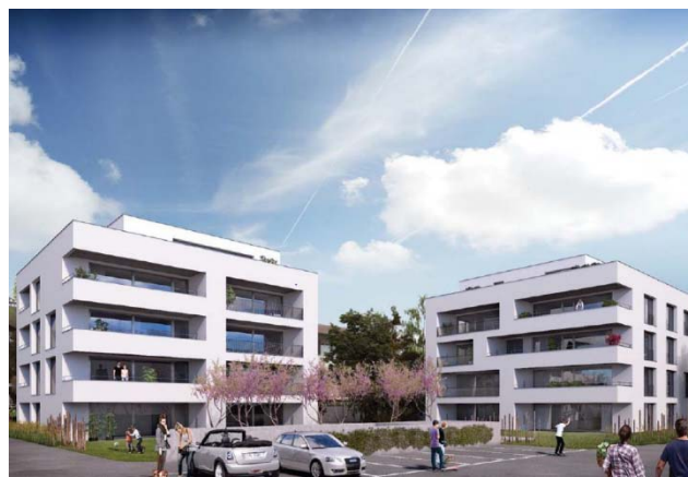
Zofingen AG, Riedtalstrasse 20