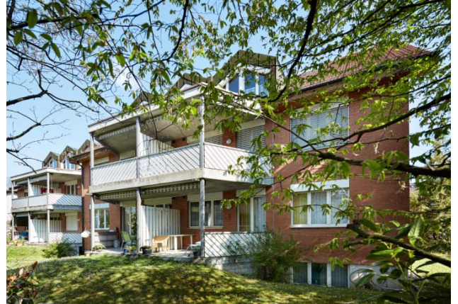
Reinach BL, Mitteldorfstrasse 2, 4

Nutzung Wohnen Baujahr 1988 Verkehrswert CHF 6.770 Mio. Bruttorendite (Soll) 4.8 % Vermietungsquote 81.2 % Kauf per 1. Dezember 2015