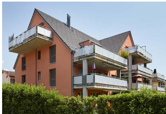
Hombrechtikon ZH, Sonnenbachweg 1