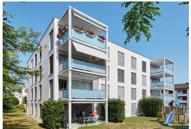
Kreuzlingen TG, Romanshornerstrasse 41

Nutzung Wohnen Baujahr 2005 Verkehrswert CHF 7.830 Mio. Bruttorendite (Soll) 4.2 % Vermietungsquote 82.5 % Kauf per 31. Dezember 2017