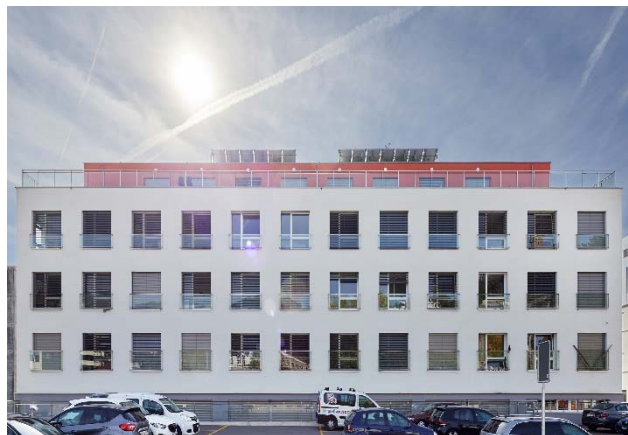
Clarens VD, Avenue Rousseau 24 / Avenue de Châtelard 1

Nutzung Wohnen Baujahr 1974 Verkehrswert CHF 27.910 Mio. Bruttorendite (Soll) 4.1 % Vermietungsquote 92.6 % Kauf per 1. Juni 2018