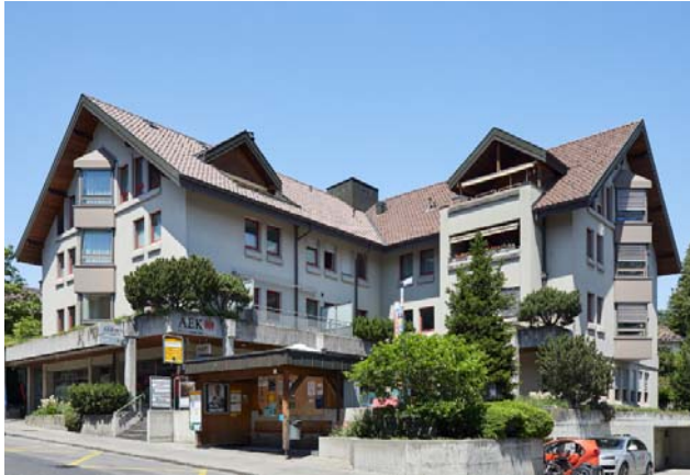
Spiez BE, Oberlandstrasse 9

Nutzung Kommerziell Baujahr 1989 Verkehrswert CHF 6.190 Mio. Bruttorendite (Soll) 5.2 % Vermietungsquote 93.9 % Kauf per 1. Januar 2017