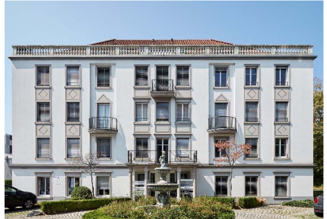
Dübendorf ZH, Überlandstrasse 105 - 111

Nutzung Kommerziell Baujahr 1989-1993 Verkehrswert CHF 21.803 Mio. Bruttorendite (Soll) 5.3 % Vermietungsquote 91.6 % Kauf per 28. Juni 2017