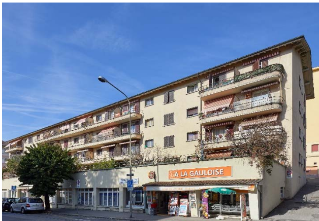
Corsier-sur-Vevey VD, Chemin-Vert 7, 9, 11

Nutzung Wohnen Baujahr 1955 Verkehrswert CHF 12.550 Mio. Bruttorendite (Soll) 4.5 % Vermietungsquote 96.7 % Kauf per 7. Dezember 2017